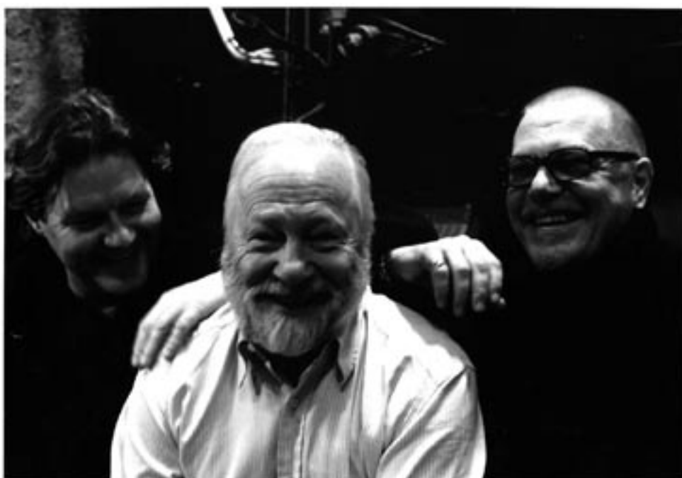
Stockholms stadsteater. Johan Rabaeus, Ingvar Hirdwall och Peter Andersson i Fastighetsskötaren av Harold Pinter.